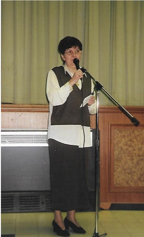
Opening van een ontmoetingsfeest (2000)