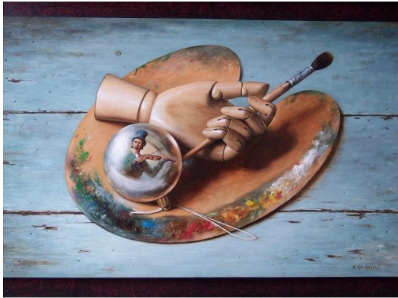
Een typisch schilderij van Van Hoylandt