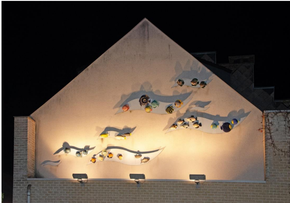
Kunstwerk "als een vis in 't water" in de Korte Vissersstraat